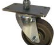
Speciální kola speciál Sázavan