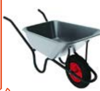
Manipulační technika stavební kolečka