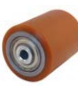
Kola pro paletizační vozíky polyuretanová - zadní