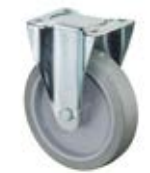
Transportní kola B63