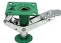
Speciální kola brzdící patky