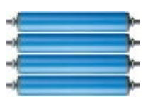
Dopravníkové systémy dopravníkové válečky