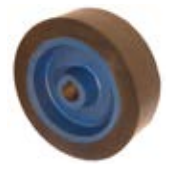
Samostatná kola hnací M180