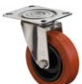
Nerezová kola - INOX B21 - teplotvzdorná