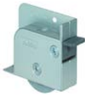
Nábytkové doplňky G93