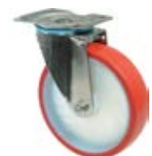
Nerezová kola - INOX B26 - transportní