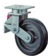
Odpružená kola B81