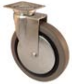
Přístrojová kolečka MGD