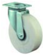
Zátěžová kola B16