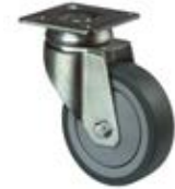
Přístrojová kolečka A85