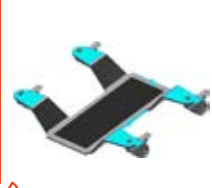
Manipulační technika speciální vozíky