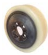
Kola pro elektrický vozík hnací kolo