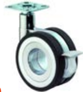
Designová kolečka F371