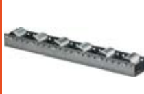
Dopravníkové systémy válečkové lišty