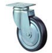
Přístrojová kolečka antistatická A89 vyšší zátěž