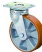
Vysokozátěžová kola B90