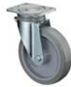
Zátěžová kola B63