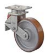
Odpružená kola C10