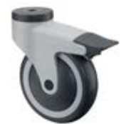
Přístrojová kolečka A82 plastová vidlice