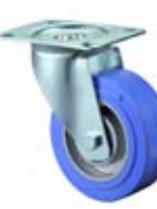
Tepluvzdorná kola B24