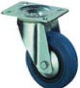
Transportní kola B61