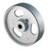
Samostatná kola litinová