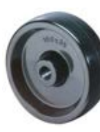
Tepluvzdorná kola samostatná B22