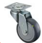
Přístrojová kolečka antistatická A89