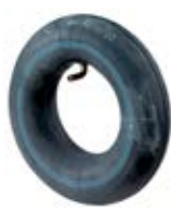
Příslušenství náhradní duše + plášť