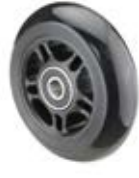
Samostatná kola skate inline kola