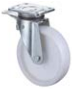
Zátěžová kola B10