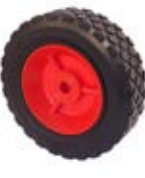
Samostatná kola plastová na sekačku