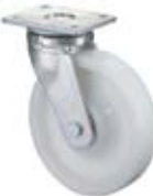
Vysokozátěžová kola B15