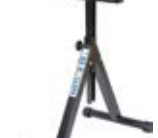
Dopravníkové systémy podpěrné stojany