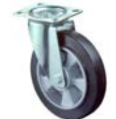
Transportní kola B80