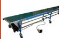
Dopravníkové systémy pásové dopravníky