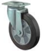
Zátěžová kola B80