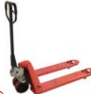
Manipulační technika paletovací vozíky