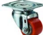
Speciální kola nízkoprofilová kolečka