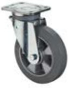
Zátěžová kola B83