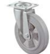
Transportní kola B83