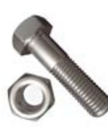
Příslušenství spojovací materiál