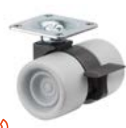
Designová kolečka E93