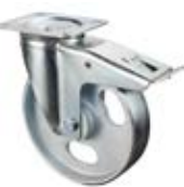
Transportní kola C80