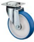
Zátěžová kola B47