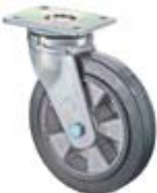
Vysokozátěžová kola B80