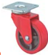
Designová kolečka F94