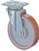
Zátěžová kola C11