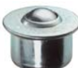
Dopravníkové systémy kuličkové jednotky