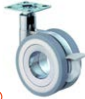
Designová kolečka F373