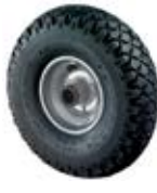
Samostatná kola nafukovací/nenafukovací