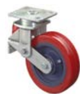
Odpružená kola C11