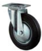
Transportní kola B55