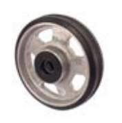
Samostatná kola gumová TKI