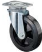
Zátěžová kola B60