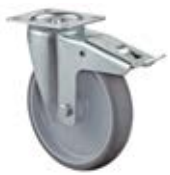
Transportní kola B44