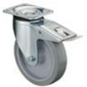
Zátěžová kola B64