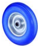
Nafukovací kola nepropíchnutelná samostatná