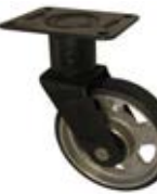
Zátěžová kola TKL otočná