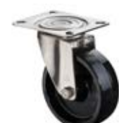
Nerezová kola - INOX B22 - teplotvzdorná