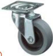
Kolečko pro nábytek F26