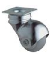
Designová kolečka F60