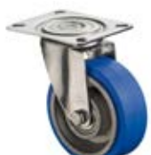
Nerezová kola - INOX B24 - teplotvzdorná