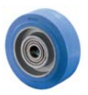
Tepluvzdorná kola samostatná B24