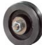
Speciální kola pro závěsné brány - vrata