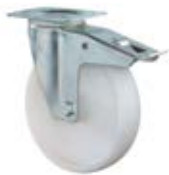
Transportní kola B10