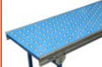
Dopravníkové systémy kuličkové stoly