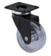
Designová kolečka F95