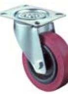
Tepluvzdorná kola B21