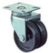
Přístrojová kolečka A90 dvojité