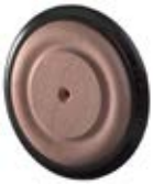
Samostatná kola dřevěná