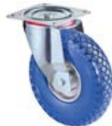
Nafukovací kola nepropíchnutelná ve vidlici