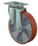
Zátěžová kola B90