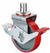
Kola pro lešení B26