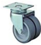
Přístrojová kolečka A80 dvojité