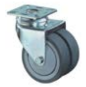
Přístrojová kolečka A85 dvojité