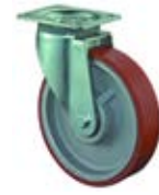
Zátěžová kola C10