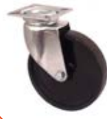
Přístrojová kolečka MN