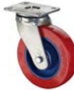
Vysokozátěžová kola C11