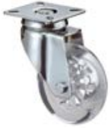
Designová kolečka A400