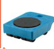
Manipulační technika stěhovací plošiny