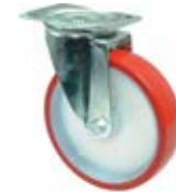
Transportní kola B31