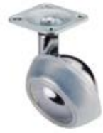
Kolečko pro nábytek F71