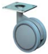
Nábytkové doplňky F328