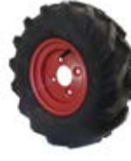
Samostatná kola hnací