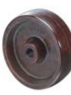
Tepluvzdorná kola samostatná B23