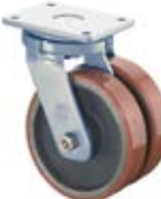
Vysokozátěžová kola dvojité C10