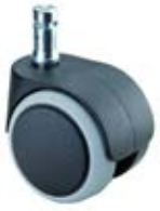
Kolečko pro židle G15