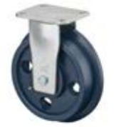
Vysokozátěžová kola C65