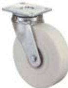
Vysokozátěžová kola B16