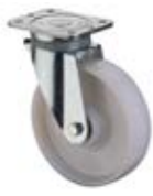
Zátěžová kola B15