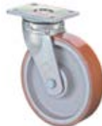
Vysokozátěžová kola C10