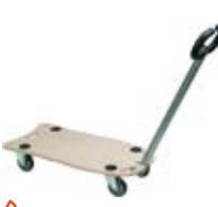
Manipulační technika plošinové vozíky