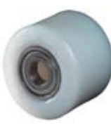
Kola pro paletizační vozíky polyamidová - zadní