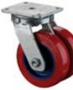
Vysokozátěžová kola dvojité C11