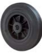
Samostatná kola gumová