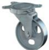
Transportní kola C75