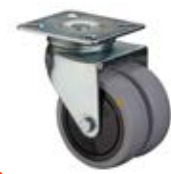
Přístrojová kolečka antistatická A89 dvojité