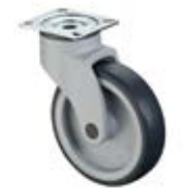
Přístrojová kolečka A81 plastová vidlice