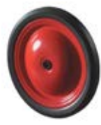
Samostatná kola plechová