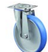
Nerezová kola - INOX B32 - transportní