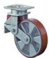
Odpružená kola B90