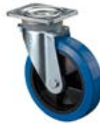
Zátěžová kola B61