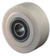
Samostatná kola polyamidová