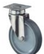
Nerezová kola - INOX A80 - přístrojová