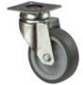
Přístrojová kolečka A80