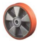
Kola pro paletizační vozíky polyuretanová - přední