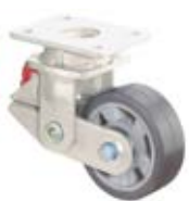
Odpružená kola B80