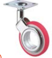
Designová kolečka F384