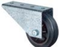
Speciální kola odpružená pro brány