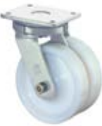
Vysokozátěžová kola dvojité B15