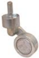
Tepluvzdorná kola TNA 3Z