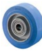
Samostatná kola tepluvzdorná