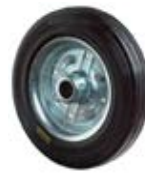
Samostatná kola antistatická