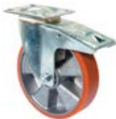
Transportní kola B90