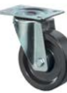
Tepluvzdorná kola B22