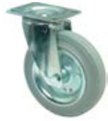
Transportní kola B56