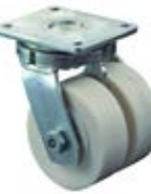
Vysokozátěžová kola dvojité B16