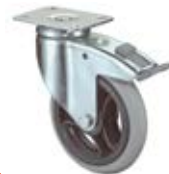
Přístrojová kolečka D20 vyšší zátěž