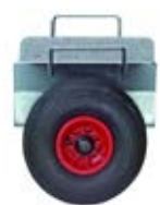
Manipulační technika vozík na plošný materiál