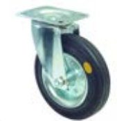
Transportní kola antistatická B58