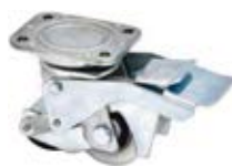
Speciální kola se zvedací patkou