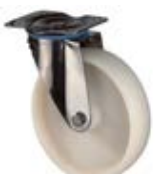
Nerezová kola - INOX A90 - transportní