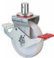
Kola pro lešení A90