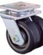
Vysokozátěžová kola dvojité B81