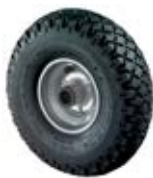
Nafukovací kola samostatná C90