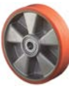
Samostatná kola polyuretanová