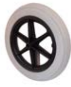
Samostatná kola kočárky