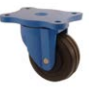
Zátěžová kola TJE