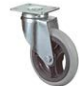
Přístrojová kolečka A86 vyšší zátěž